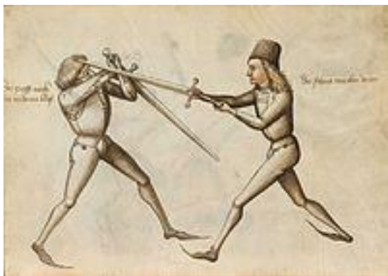
Imaginea 1. Scrima istorică, lupta cu spada, secolul XIII-XV

avem la dispoziție doar câteva mici izvoare, ce ne descriu arta de a mânui spada în timpul războaielor din secolul XIII-XV (Imaginea 1), [1, 3].