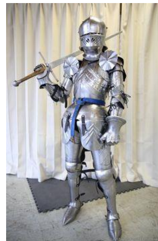
Imaginea 2. Echipament specific competițiilor la scrima istorică

Metodologia și organizarea cercetării. Pentru atingerea scopului vizat, au