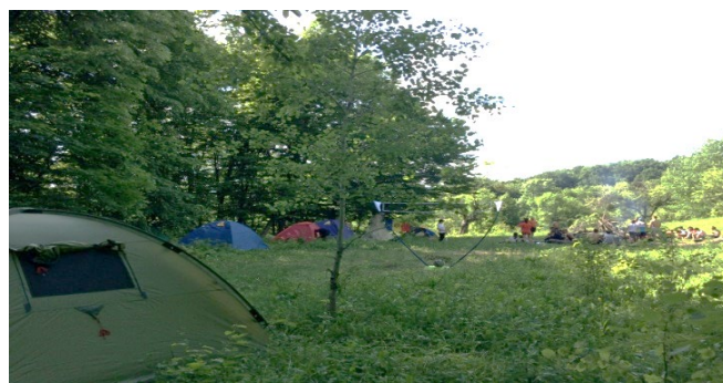
Fig. 1. Amenajarea unui bivuac turistic

Profesorii la tehnica organizării bivuacului turistic ar trebui să învețe elevii să aleagă locul pentru bivuacul turistic (ex: pe teritoriul școlii), să monteze corturile, să construiască focul de tabără, să amenajeze un teren sportiv în condiții de drumeție (Fig. 1).