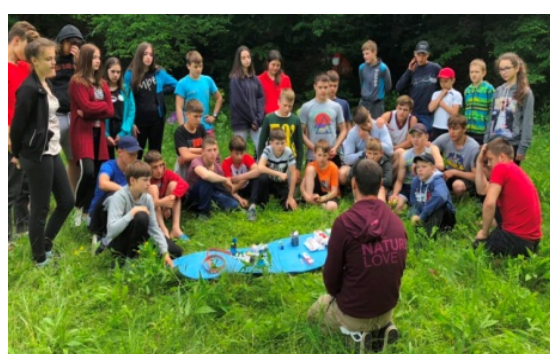
Fig. 3. Tehnica de acordare a primului ajutor și transportarea accidentatului în cadrul turismului pedestru